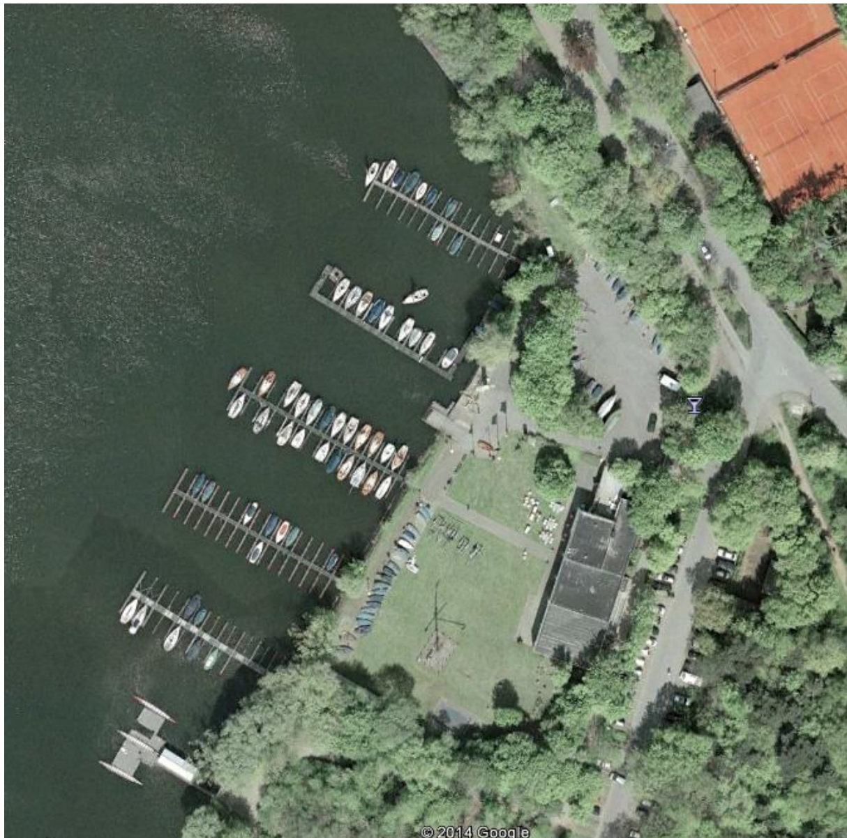
Der Duisburger Yacht Club e. V.

Diese Clubs waren der Duisburger Yacht-Club e. V. (alt) sowie der Segelclub Montan e. V. Beide Clubs hatten interessante Vorgeschichten, an die sich einige ältere Mitglieder noch lebhaft erinnern können, die aber auch für nachwachsende Generationen interessant sein dürften.